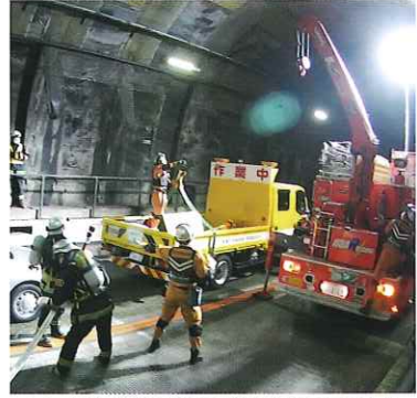
トンネル総合防災訓練(令和3年12月)