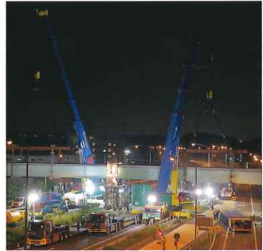
跨道橋撤去イメージ(別工事)